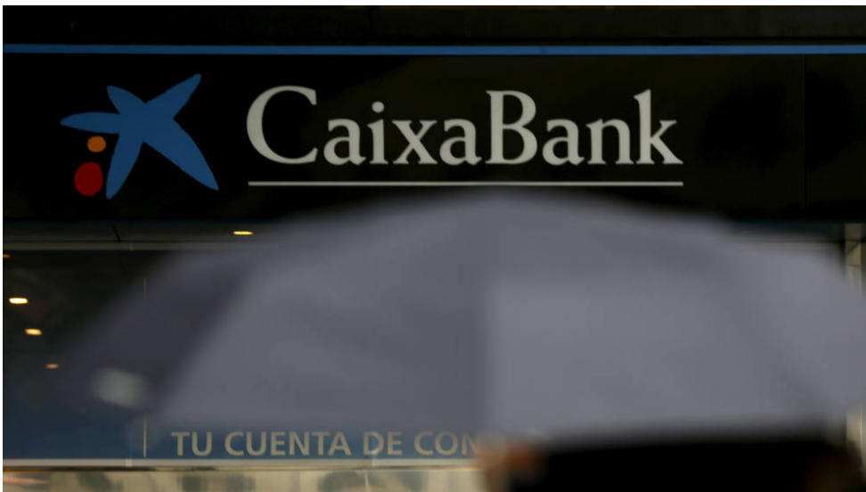
Sucursal de CaixaBank en Madrid.

Las sentencias condenan a CaixaBank y BBVA con argumentos casi idénticos: los bancos empaquetaron con el préstamo un seguro de vida cuya póliza se firmó y se abonó el día de la hipoteca